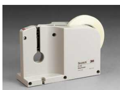
P-410 Для запечатывания пакетов