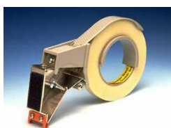
H-131 Для нанесения L-клипс лентами 890, 8959 и пр.