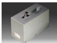
S-63 Для нанесения L-клипс, настольный диспенсер