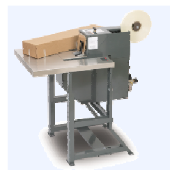
S-867 Для нанесения L-клипс, пневматика