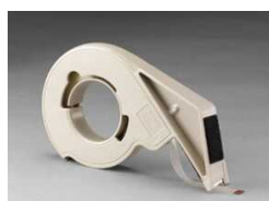
H-133 Для нанесения L-клипс, экономичная модель