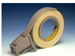
H-130 Для высокопрочных лент, с механизмом натяжения