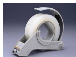
H-38 Для нанесения тянущихся лент 8884 и 8886