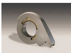
H-12 Для высокопрочных лент, с механизмом натяжения