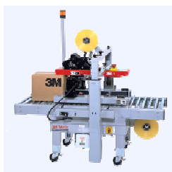
800a Для узких коробок, боковые ремни