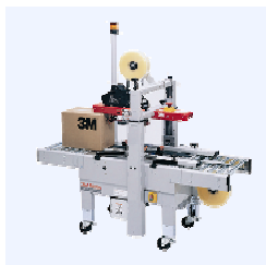
200a Доступная модель для нетяжелых коробок