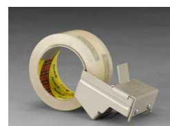
H-128 Для усиленных лент и высоких нагрузок