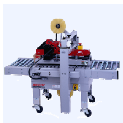
800asb Для маленьких коробок