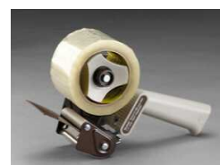
H-183 Для общей упаковки, с механизмом натяжения