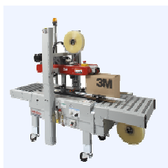
700r Для стандартных коробок, автонастройка габаритов