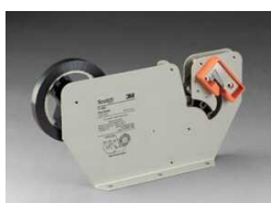
P-400 Для запечатывания пакетов, с триммером