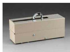
S-634 Для нанесения L-клипс, промышленная версия S-63