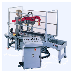
800rf Полный автомат