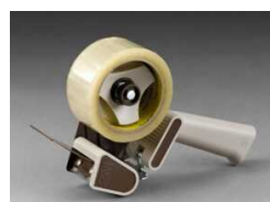
H-180 Для общей упаковки