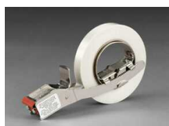
H-120 Для высокопрочных лент, металлический