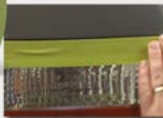
Прилегаемость к неровным поверхностям