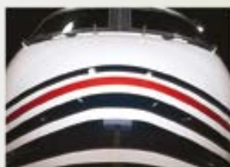
Идеальна для двухцветной окраски