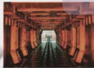
Температурная стойкость до 160°C